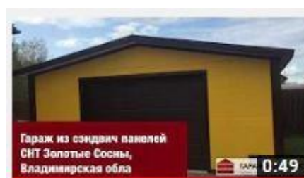
Гараж из сэндвич-панелей СНТ Золотые Сосны