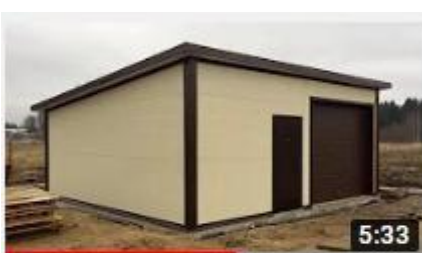
Гараж из сэндвич панелей КП Большая Вода