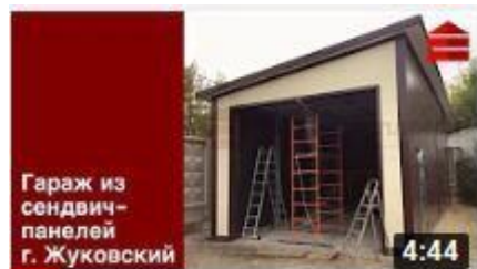
Гараж для ГАЗели из сэндвич-панелей в г....