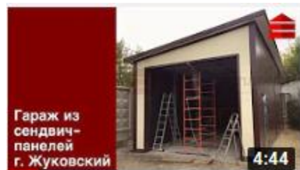
Гараж для ГАЗели из сэндвич-панелей в г....