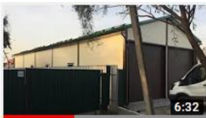
Ангар из сэндвич панелей д. Малые Вяземы