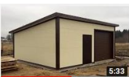
Гараж из сэндвич панелей КП Большая Вода