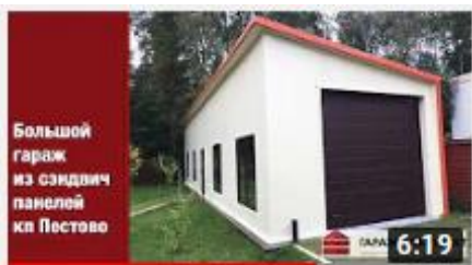
Большой гараж из сэндвич панелей в кп Пестово