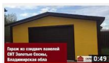
Гараж из сэндвич-панелей СНТ Золотые Сосны